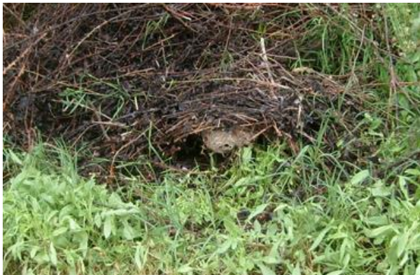
Abbildung 1: Vornest im Frühling

Daher bitten die Behörden der Region Nordwestschweiz von April bis Anfangs Juli vor allem um Beobachtungen von Hecken, Unterständen, Vordächern und ähnlichen geschützten Stellen. Dort könnte sich ein Vornest befinden. Beispiele finden Sie weiter unten (Abbildungen 1 und 3).