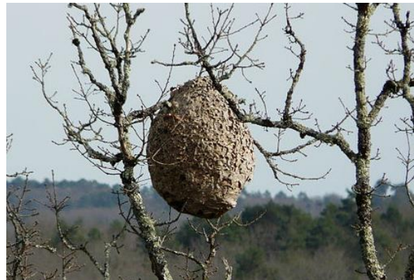
Abbildung 2: Hauptnest in Baumkrone

Bitte melden Sie verdächtige Vor- und Hauptnester und Insekten (mit Bild und Koordinaten) an die Meldestelle für verdächtige Insekten und Nester: