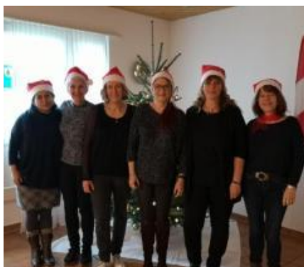
Seniorentreffen Drei Höfe