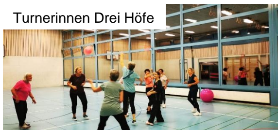
Turnerinnen Drei Höfe